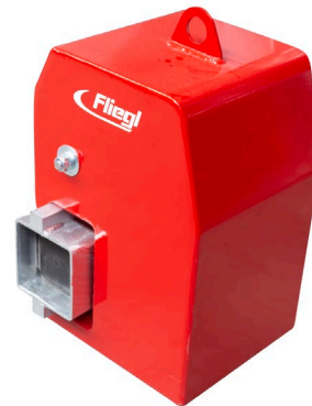
Motvikt, ca 210 kg