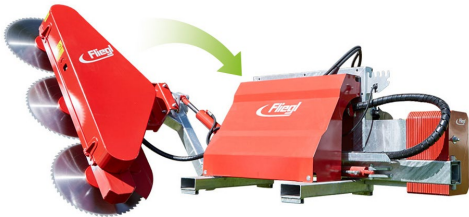
111° tippningsanordning för beskärningssåg (inkl. styrenhetsförlängning)