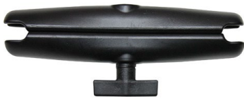
Adapterarm 231 mm