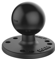
C-kula med platta