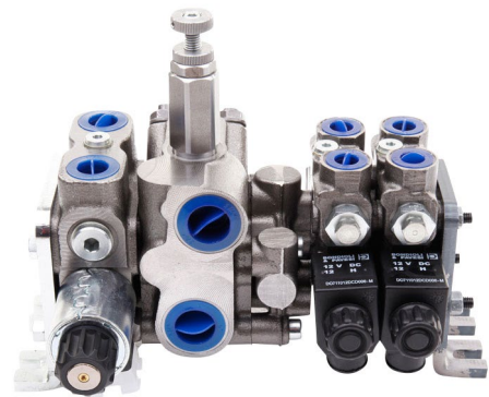
Tillägg för elkontrollblock