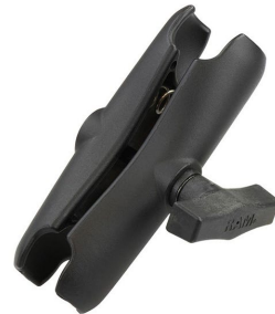
Anslutningsarm för C-kula