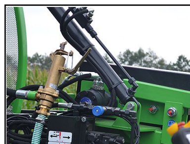
ADS: Automatiskt Drive Stop