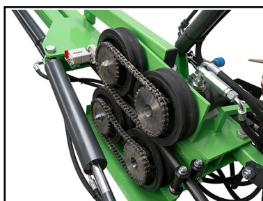
4 st drivhjul