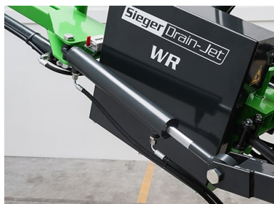
Modell HS & WR hydr. svängbar i sidled