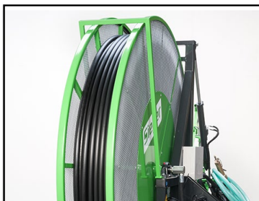
500 m HPE-slang